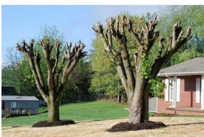
L'étêtage de l'arbre