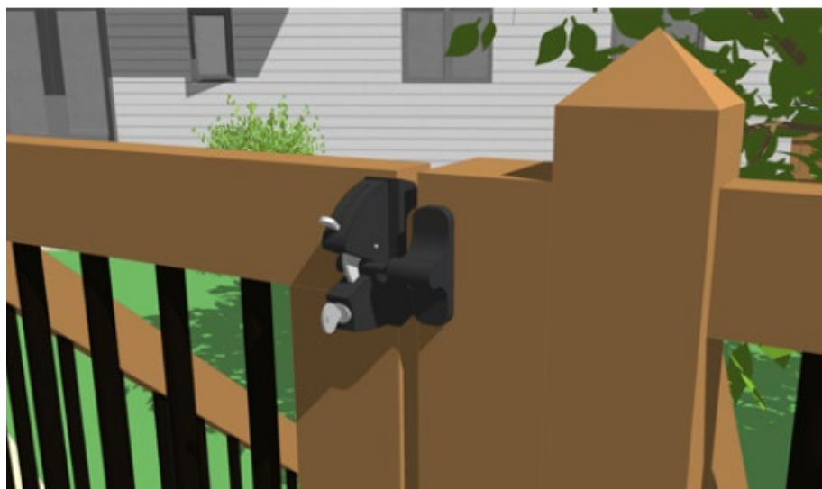
Extrait du guide d'application du ministère des Affaires municipales et de l'Habitation

Toute porte doit aussi être munie d'un dispositif de sécurité passif lui permettant de se refermer et de se verrouiller automatiquement. Ce dispositif peut être installé soit du côté intérieur de l'enceinte dans la partie supérieure de la porte, soit du côté extérieur de l'enceinte seulement si à une hauteur minimale de 1,5 mètre par rapport au sol. La porte doit s'ouvrir dans le sens où le loquet est installé.