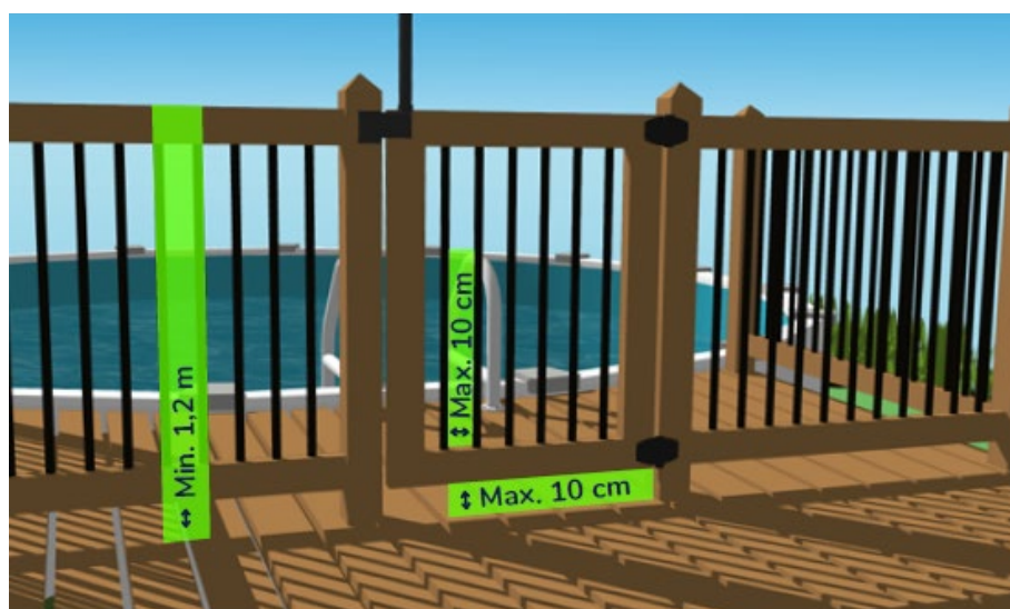
Extrait du guide d'application du ministère des Affaires municipales et de l'Habitation

Un mur formant une partie d'une enceinte ne doit être pourvu d'aucune ouverture permettant de pénétrer dans le lieu clôturé. Toutefois, un tel mur peut être pourvu d'une fenêtre si elle est située à une hauteur minimale de 3 mètres par rapport au sol ou dans le cas contraire, si son ouverture maximale ne permet pas le passage d'un objet sphérique de plus de 10 cm de diamètre. Le but étant d'empêcher d'avoir une ouverture directe sur la piscine et ainsi éviter les noyades!