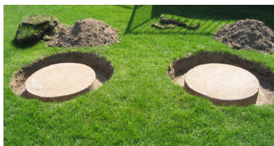
Figure 3 : Couvercles bien dégagés

Pour faciliter l'exécution du programme de mesurage, il est exigé de laisser les couvercles de votre fosse septique accessibles en tout temps et de prévoir un dégagement minimal de 15 cm autour des couvercles :