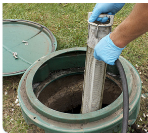
Figure 4 : Nettoyage du préfiltre

Lorsque la fosse septique comporte un préfiltre, celui-ci devrait être nettoyé au moins deux fois par année. Le colmatage du préfiltre est une cause fréquente de refoulement des eaux usées. Le préfiltre est accessible via le 2 e couvercle de la fosse et doit être retiré pour être rincé.